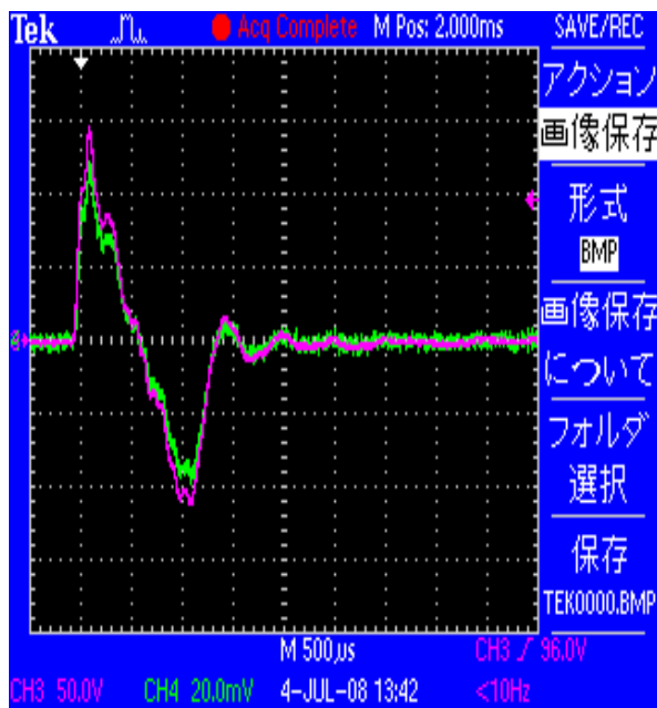
図2. オシロスコープで発電モニタ例 赤線：発生電圧で縦軸1目盛：50V 緑線：発生電流で縦軸1目盛：200mA

図1に示す逆磁歪式振動発電機にて黄銅球を自由落下衝突させたところ、図2に示す様に瞬間最大電圧146V、瞬間最大電流0.49Aを発現し、瞬間最大発生電力71Wが得られました。